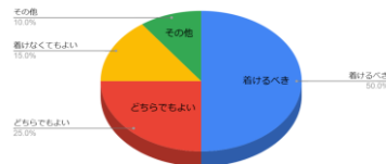
手ぬぐいを着けるべきか（およその割合）

約 60 % 手ぬぐいを着ける理由に共感 約 50 % 手ぬぐいを着けるべきである